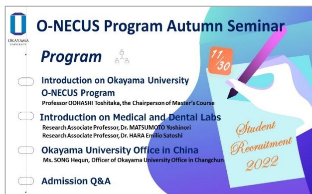
セミナーのプログラム