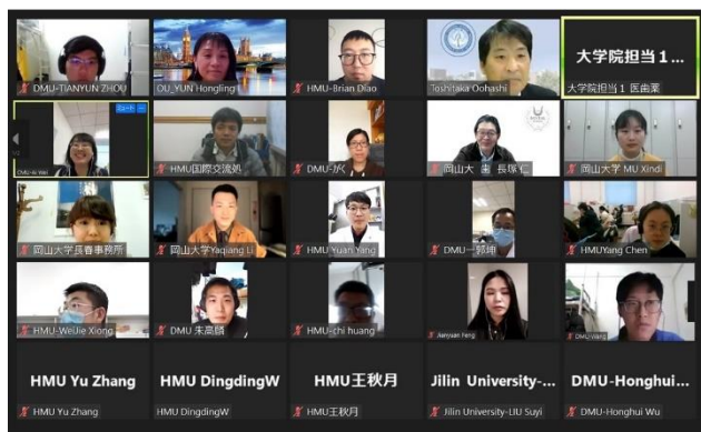
セミナー参加者ら

コロナ禍でありながら参加者も多く、活発な質疑から本プログラムへの関心が高まっていることがうかがえます。今後も継続してセミナーを実施し、優秀な学生の獲得と研究交流の活性化に繋げていきます。